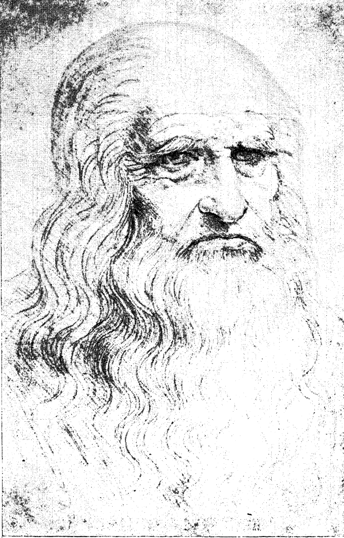
स्वतःचे व्यक्तिचित्र तुरिन, इ. स. १५१२